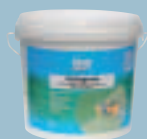
Temeljni premaz Knauf Tiefengrund